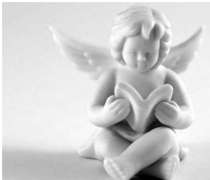
Az ideális olvasó...

Mindenképp ajánlatos, ha felkészülve a kritikus jelenségekre, a könyvtárhasználati szabályzatban rögzítjük az intézményünkben alkalmazandó szankcionálás – a könyvtárlátogatástól