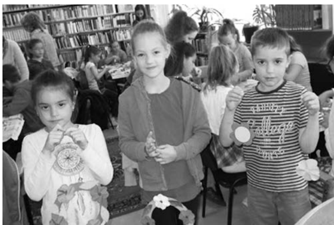
Szünidei szerda – kézműves foglalkozás