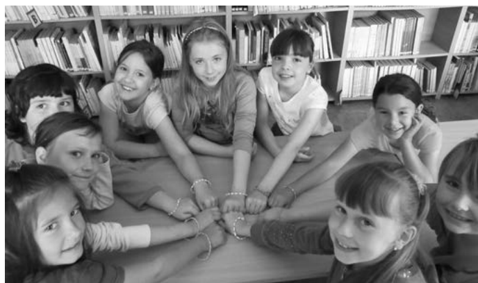
Cyöngyfüzés a legjobb időtöltés

Hogyan kellene a gyerekeket olvasóvá nevelni? Ezt a feladatot az iskolák a könyvtárral karöltve oldhatják meg. Ennek leghatásosabb formája pedig a könyvtári foglalkozás, amelynek keretében bármilyen témát fel lehet dolgozni, tehát minden tantárgy oktatásában használni lehet.