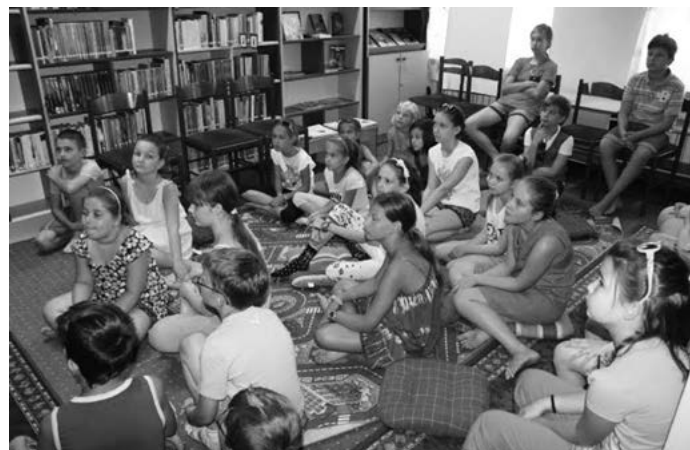
A mese bűvöletében

Rendkívül népszerű a városban a könyvtár által szervezett nyári napközis olvasótábor. Minden év augusztusában, három héten keresztül tematikus hetekkel, különféle programokkal várják a könyvtárosok a gyere-